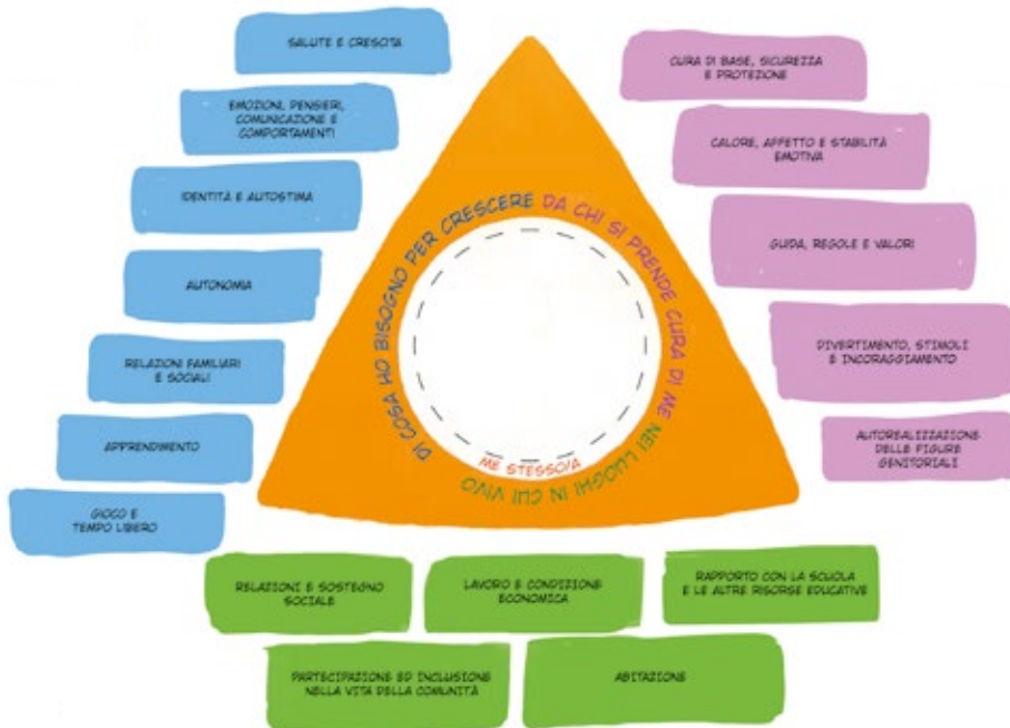
Figura 1. Il Mondo del Bambino (versione operatori)

Vengono proposte tre versioni de “Il Mondo del Bambino”: una definita “versione operatori” che presenta un linguaggio tecnico professionale, una “versione bambini” che utilizza un linguaggio adatto a bambini/ragazzi e genitori e una “vuota” finalizzata a essere utilizzata per raccogliere le voci dei bambini e delle figure genitoriali sulla loro situazione.